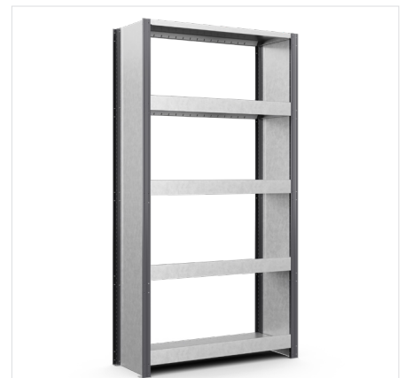
Voor-/achteraanslag Breedte: 1000 mm, 1300 mm