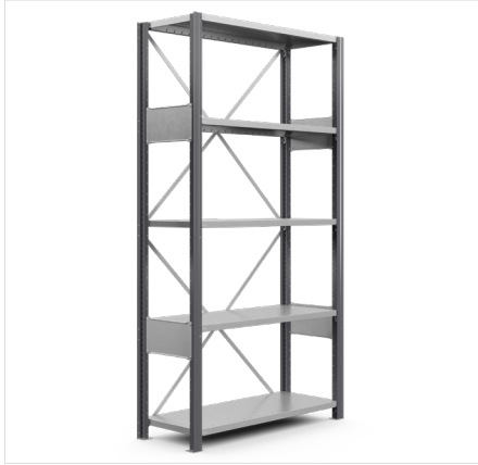
Frame, open Hoogte: 2000 mm, 2500 mm, 3000 mm Diepte: 300-600 mm