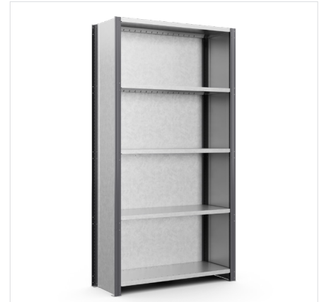
Achterplaat Hoogte: 2000 mm, 2500 mm, 3000 mm Breedte: 1000 mm, 1300 mm