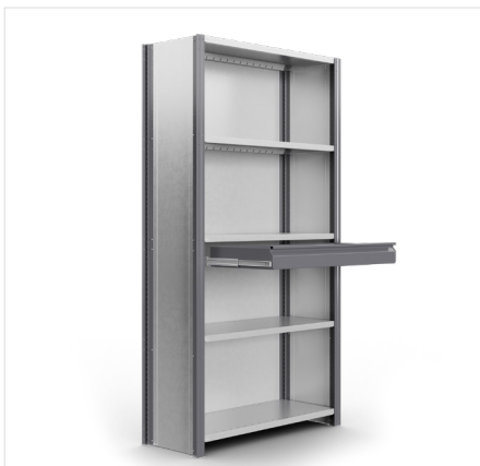
Uittrekelement Diepte: 400 mm, 500 mm Breedte: 915 mm