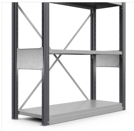
Onderplint Hoogte: 40 mm Breedte: 1000 mm, 1300 mm