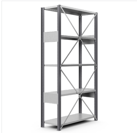
Rug schoring Breedte: 1000 mm, 1300 mm