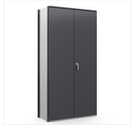
Deursectie Hoogte: 2000 mm Breedte: 1000 mm