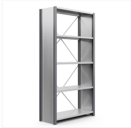
Frame, gesloten Hoogte: 2000 mm, 2500 mm, 3000 mm Diepte: 300-600 mm