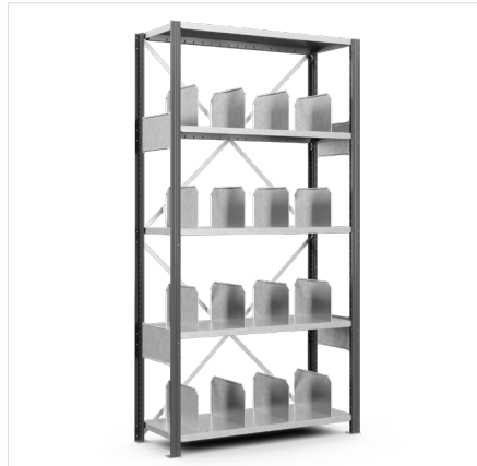
Vakverdelers Diepte: 200*300-600 mm