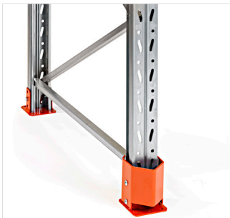
Staanterversteviging voor 90 mm/110 mm staander, voor montage samen met de voetplaat.