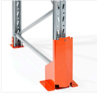
Staanterbeschermer, hoogte 400 mm