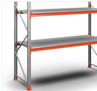
Legborden - Voor goederen zonder pallets. Breedte 455 mm.