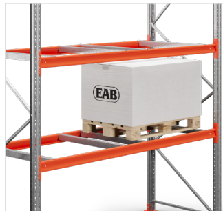
Tussenligger lange zijde - voor de opslag van pallets aan de lange zijde, lengte 1068 mm.