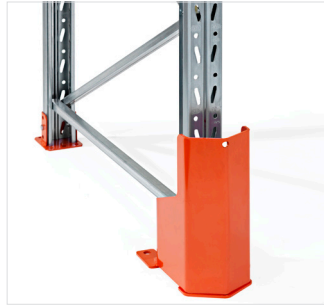
Staanterbeschermer, hoogte 400 mm met polyurethaan schokbreker.