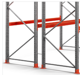
Spacers voor frames - voor montage in dubbele stelling.