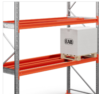
Tussenligger halve pallet - maakt de opslag van halve pallets mogelijk in palletstelling met een diepte van 1100 mm.