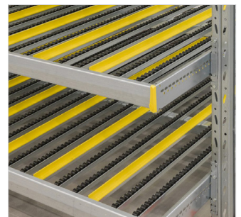
Doorrolstellingen - hellende rolframes gemonteerd in palletstelling voor snel en effectief orderpicken.