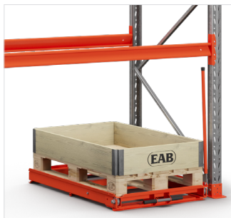
Trekklade voor installatie op betonnen vloer.