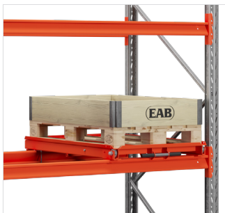
Trekklade - gebruikt om de beste ergonomie te bereiken bij het verzamelen vanaf pallets. Verkrijgbaar in verschillende ontwerpen.