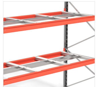
Tussenligger halve pallet - maakt de opslag van halve pallets mogelijk of als extra ondersteuning voor normale pallets.