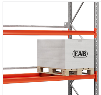
Horizontale palletstop - te monteren aan de achterkant van het frame om te voorkomen dat pallets te ver worden doorgeschoven.