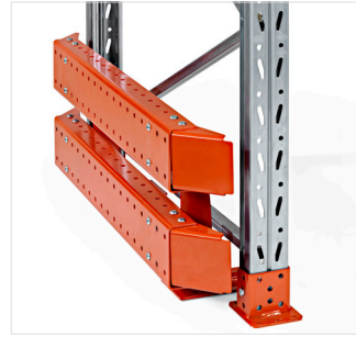
Framebescherming, hoogte 400 mm - voor eindframe en gangpaden.