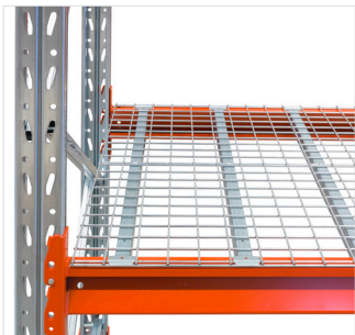
Gaaslegbord - voor goederen met of zonder pallet. Breedte 910 mm. Palletgewicht: 500 kg of 1000 kg.